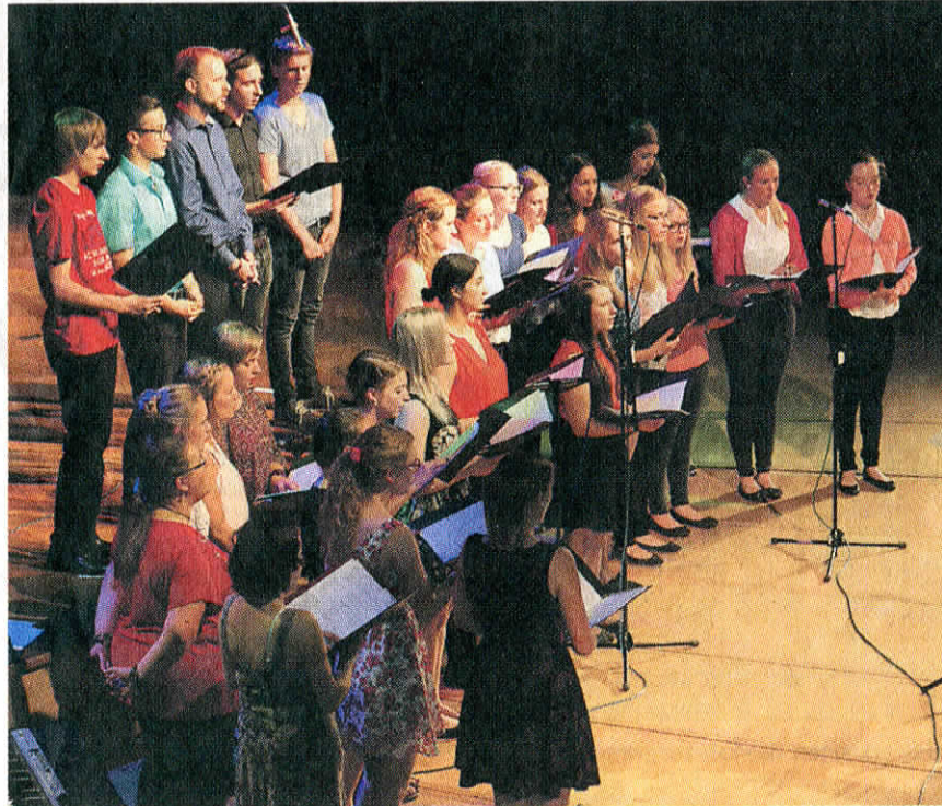
Die „Smilin' Faces“ erhielten viel Applaus.

lich“, schwärmte Käberich. „Auch die Musiker sind sehr zufrieden“. Schade ist nur, dass es für manche der Musiker das letzte Mal war, denn die Schülerinnen und Schüler des Campe Gymnasiums, die dieses Jahr ihr Abitur gemacht haben, werden in den nächsten Jahren nicht mehr dabei sein.